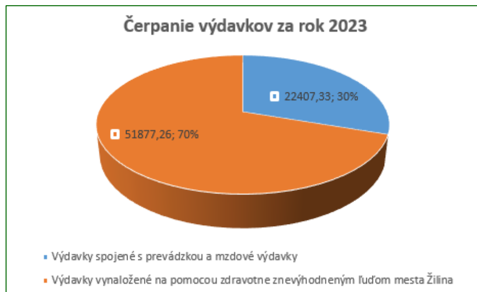
Graf 2 Čerpanie výdavkov za rok 2023

*Z celkovej sumy 20 327,49 EUR sú krátkodobé záväzky 1 819,11 EUR a sociálny fond 147,24 EUR.